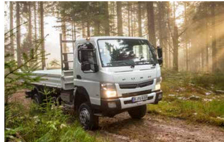
Canter 6C18 4x4 mit Meiller Kipper