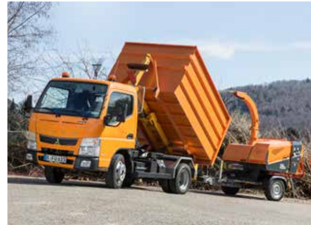
Canter 6S15 als Abrollkipper