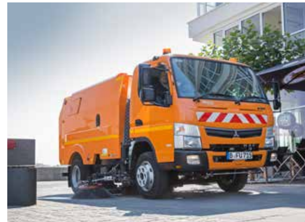
Canter 7C15 mit Kehrmachine

Informieren Sie sich über die weiteren Anwendungsmöglichkeiten des Canter unter www.fuso-trucks.de oder bei Ihrem FUSO Händler.