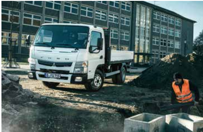
Canter 7C15 mit Scattolini Kipper