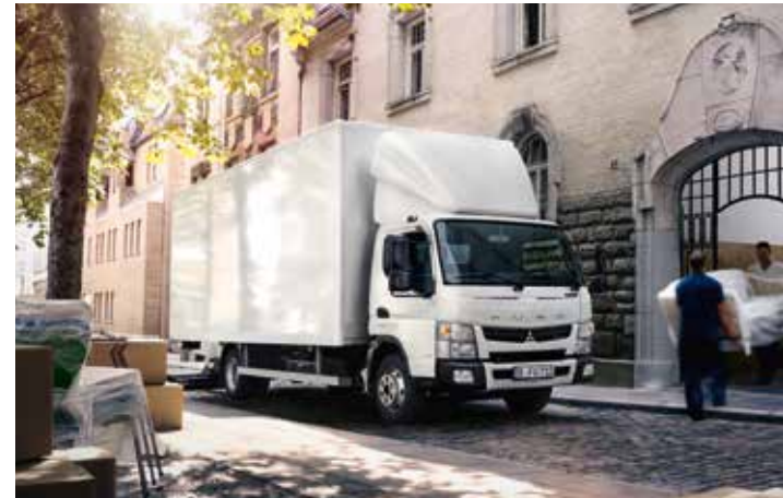
Canter 7C15 mit Koffer