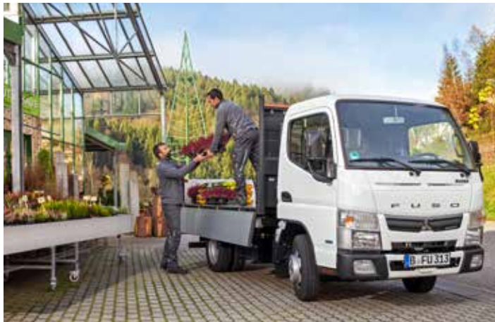
Canter 3S13 mit Scattolini Pritsche